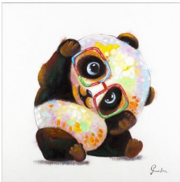
Hallo kleiner Pandabär!

Wie das Ganze mit den Prato Farben von Rico Design dann fertig aussehen kann, sobald es professionell umgesetzt ist, zeigen die wunderschön gestalteten Bilder von Kunstloft , die sich wirklich in jeder Wohnung einfach wunderbar machen: